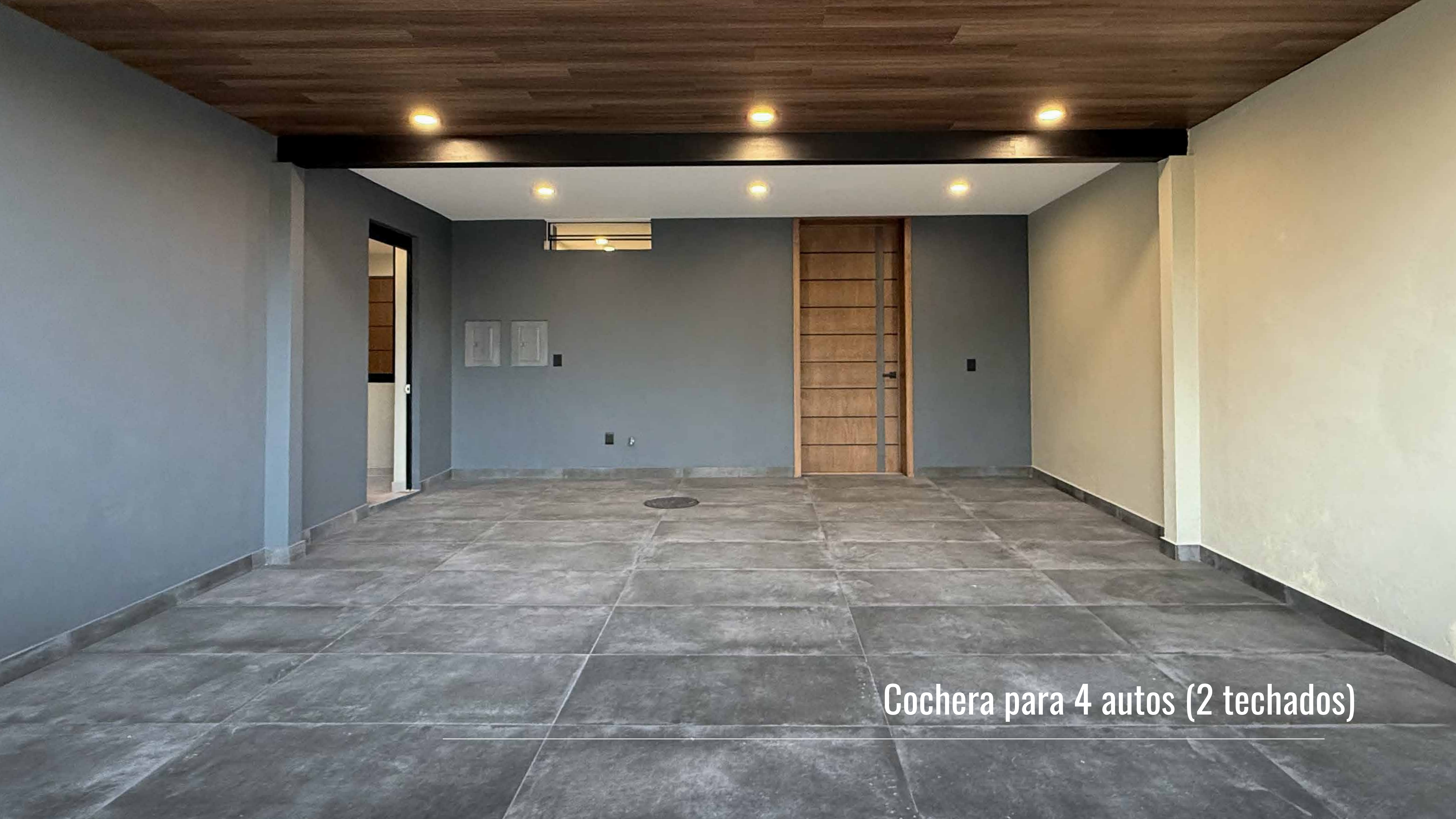
Cochera para 4 autos (2 techados)